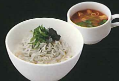
釜揚げしらすの バターソテーどんぶり ¥940 s¥790