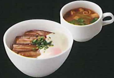
豚角煮とろろどんぶり ¥1,170 s¥1,020