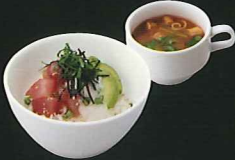
天然鮪とアボカドの とろろどんぶり ¥1,200 s¥1,050