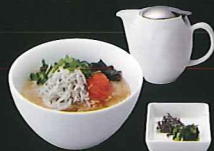
釜揚げしらすと 明太子の出汁茶漬け ¥830