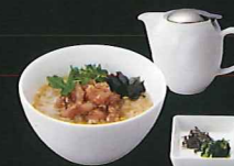
天然カジキ鮓の 胡麻和え出汁茶漬け ¥900