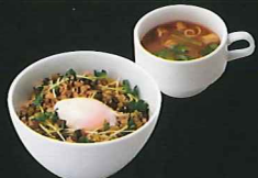
鶏そぼろどんぶり ¥940 s¥790