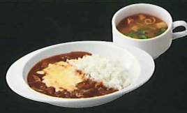
牛肉チーズハヤシライス ¥1,170