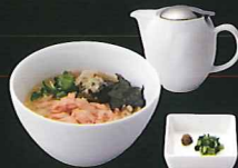
鮭ととろろ昆布の 柚子胡椒出汁茶漬け ¥830