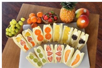
デアイザベーカリー