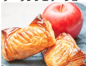
ブーランジェリーショー