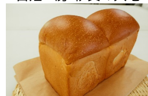
百姓工房 伊賀の大地