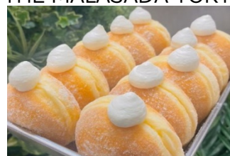
THE MALASADA TOKYO